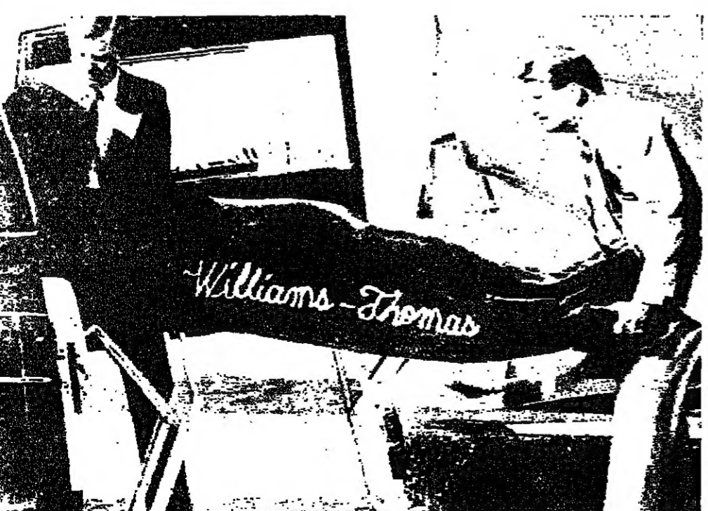
بقي تيودور (تيد) باندي على لائحة الاعدام طوال ١٠ سنوات . الى ان نلأ فيه الحكم في ٢٤ الجارى بواسطة عربة الموت بعد عملية التشريح المتعبة التي تمت في مركز المقاطعة الطبي . الكريسي الكيريباتى . في الصورة . عملية نقل الجثمان الى غينزفيل (فلوريدا) - ر